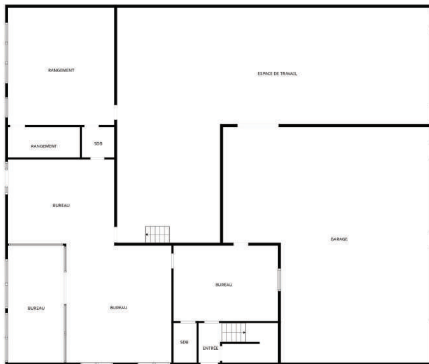
1 ER ÉTAGE (RDC)