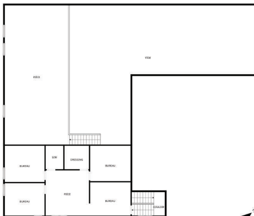
2 ÈME ÉTAGE